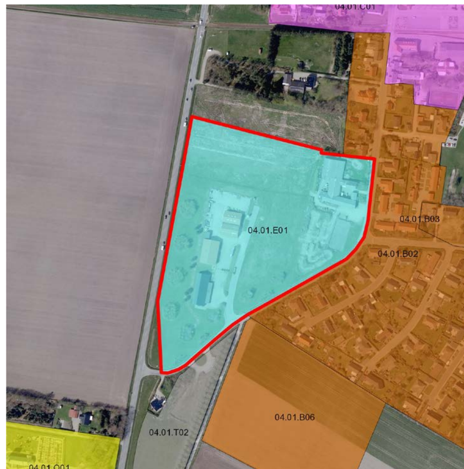
Figur 1: Afgrænsning af rammeområde 04.01.E01 til erhvervsområde. Der sker ingen ændringer af rammeområdets afgrænsning.

Lokalplaner, der træffer bestemmelser for rammeområde 04.01.E01, skal være i overensstemmelse med de bestemmelser, der er indeholdt i bilag 1, Tabel 1.